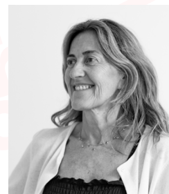
Miren Gorriti Administración