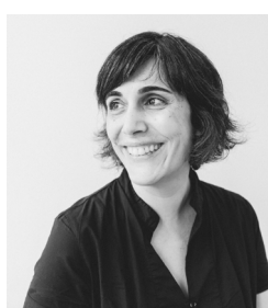
Silvia Solas Identidad de Marca & Diseño