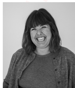
Haizea Alustiza Copy Creativa