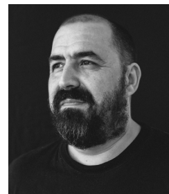
Gorka Azpíroz Diseño & Animación